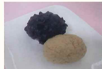
粒あん・きな粉のおはぎ