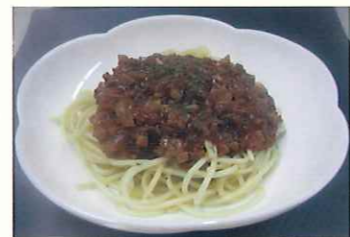
シカ料理 ミートソース・スパゲティ