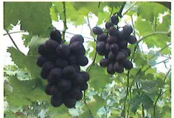
三日月高原ぶどう