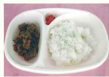
シカキーマカレー