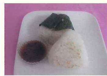
佐用の新米おにぎり(ねぎ味噌焼き)