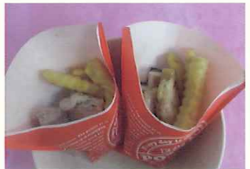
ひまわり地鶏の塩焼き & フライドポテト