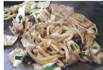
ホルモン焼うどん