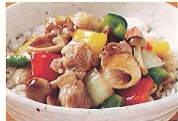
さよう姫ポークのスタミナ丼