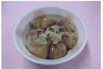
もち大豆きな粉の豆乳もち