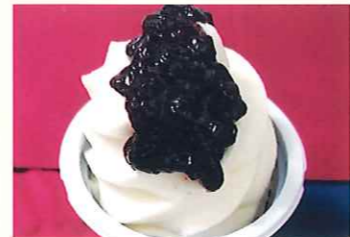
アイスクリーム(ブルーベリージャム)