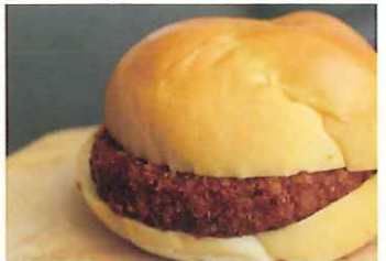
おからコロッケバーガー