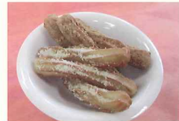
もち大豆きな粉チュロス