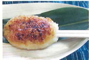
もち大豆みその五平餅